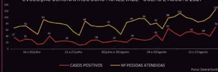
EVOLUÇÃO CORONAVÍRUS JOÃO MONLEVADE - JULHO E AGOSTO 2021