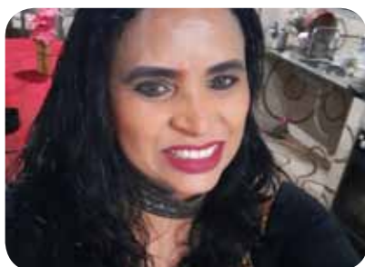
Nair da Mata - 23/08